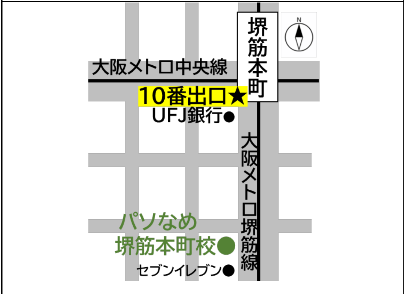
託児場所在地地図

訓練実施施設住所: 〒 541-0057 大阪府大阪市中央区北久宝寺町二丁目2-13 マエダ本社ビル 306